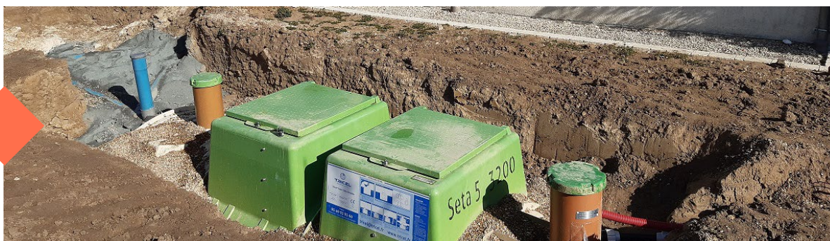
Installation d'ANC chez un particulier