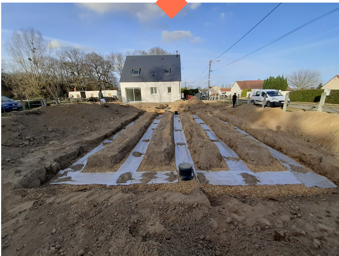
Installation d'ANC chez un particulier - Source : SATESE 37

Cette note, à l'attention des maîtres d'ouvrage et des constructeurs d'assainissement non collectif, décrit leurs droits et obligations en matière d'assurance pour la mise en place d'une installation d'ANC.